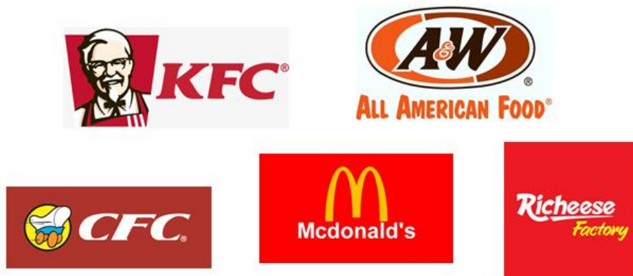
Gambar 2. Logo Lima Waralaba Ternama FC di Indonesia